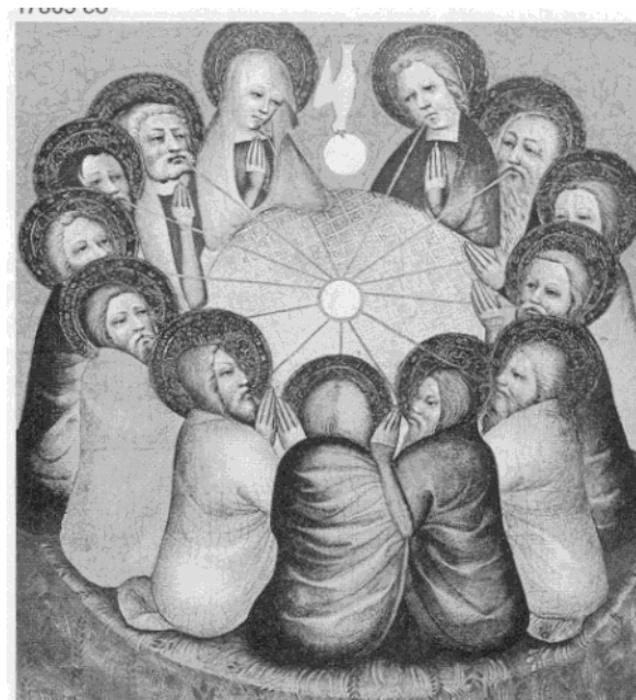
Westfälischer Meister, Pfingsten, um 1370-1380

vom 20.08.2006 – 02.09.2006 20. u. 21. Sonntag im Jahreskreis